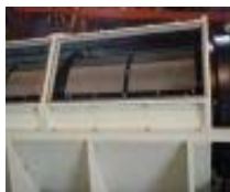
【カバー取外し状態】