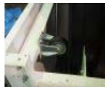
【スラストローラー】